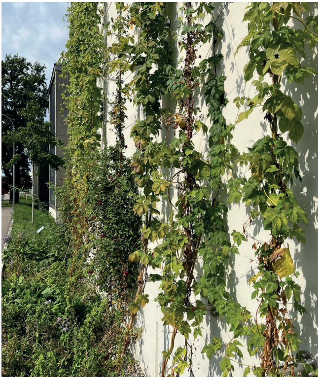
Abbildung 3: : Pflanzenauswahl ausschliesslich einheimisch

Im Rahmen des Programm Stadtgrün, in Form eines Pilotprojekts, wird ein Abschnitt der Fassade sowie eine Teilfläche der Busgarage der Verkehrsbetriebe Zürich (VBZ) mit einheimischen Pflanzen begrünt. Ziel ist die Umsetzung einer grossflächigen, vertikalen Begrünung, die ausschliesslich auf heimische Kletterpflanzen und ergänzende Unterbepflanzung setzt. Dieses Vorhaben verbindet ökologische Verantwortung mit städtischer Gestaltung und leistet einen wichtigen Beitrag zur Förderung der Biodiversität im urbanen Raum.