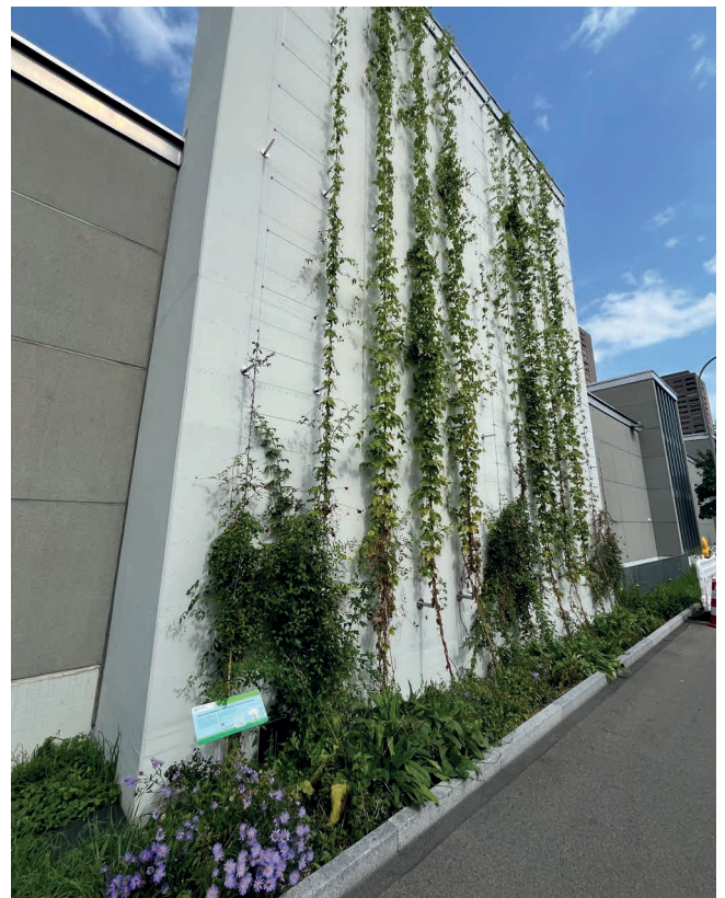
Abbildung 4: Begrünung im August (Pflanzung im April)

Für eine dauerhaft vitale und leistungsfähige Begrünung sorgt eine computergesteuerte Bewässerungsanlage, die die Pflanzen gezielt über Tropfleitungen mit Wasser versorgt. Die Pflege erfolgt in der Anfangsphase vom Boden aus und kann mit zunehmendem Pflanzenwachstum mithilfe einer Hebebühne vorgenommen werden. Als Teil des Programms Stadtgrün für ein besseres Stadtklima und mehr Biodiversität, markiert dieses Pilotprojekt einen weiteren Schritt in Richtung klimaangepasste Stadtgestaltung und schafft neue Lebensräume mitten in der dicht bebauten Stadtlandschaft.