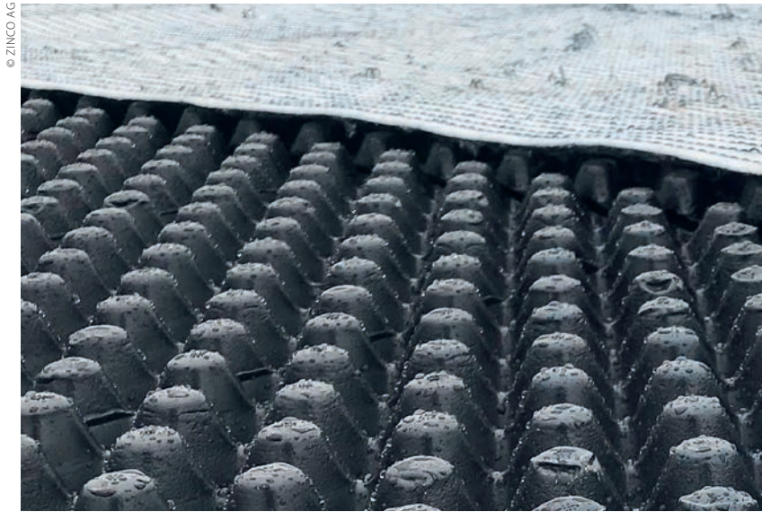
Retentionsdach im Bau: HDPE-Retentionselemente, Saugvlies als Trennlage und für den Wassertransport nach oben zur Substratschicht.