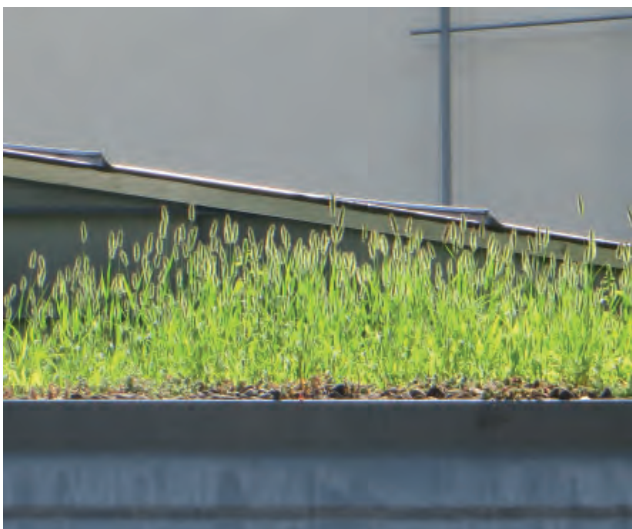
Abbildung 9: Starke Hirseausbreitung auf einem extensiv begrünten Dach.

In den letzten Jahren verbreiteten sich vermehrt Hirsen auf extensiv begrünten Dächern. Hirsen sind in der Regel einjährig, keimen bei Substrattemperaturen über 20°C und verbreiten sich sehr schnell. Sie produzieren ausserdem sehr viele Samen. Bei der Pflege empfehlen wir deshalb, diese Arten frühzeitig zu entfernen, obwohl sie die Dachhaut nicht gefährden. Können sich Hirsen einmal sehr stark versamen, bringt man sie ohne einen entsprechenden Pflegeaufwand über mehrere Vegetationsperioden fast nicht mehr los, da sie einen enormen Samenvorrat im Substrat hinterlassen.