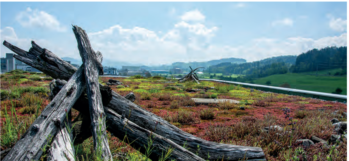
Abbildung 3: Biodiversitätsgründächer sind ökologisch höherwertige und artenreiche Extensivbegrünungen, welche eine Vielzahl an positiven Effekten haben. Dazu gehören unter anderen der ökologische Ausgleich, die Biotop-Vernetzung und die Förderung der Artenvielfalt in der Stadt.

Retentionsdächer haben das Ziel, möglichst viel Regenwasser auf dem Dach zu behalten und natürlich zu verdunsten. In der Drän- und/oder Speicherschicht wird ein temporärer oder dauerhafter Wasserspeicher geschaffen, über den eine Dachbegrünung eingebaut werden kann. Ein solches Retentionsdach weist viele Vorteile auf: Die Dachbegrünungen erhalten einen zusätzlichen Retentionsraum für Regenwasser, das zwischengespeicherte Niederschlagswasser steht den Pflanzen auf dem Dach zur Verfügung, die Abflussspitzen bei Starkniederschlägen werden um bis zu 80% reduziert und somit der Abfluss stark verzögert, was die Entwässerung entlastet. Retentions-Gründächer funktionieren nur, wenn die Dicke der Vegetationstragschicht (= Substratdicke) mindestens der Norm SIA 312 Begrünung von Dächern [3] entspricht.