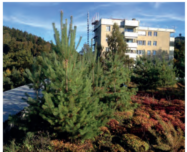
Abbildung 10: Infolge Vernachlässigung der Dachpflege konnten sich auf der Extensivbegrünung Föhren entwickeln.

Bäume und Sträucher, die flugfähige oder sehr leichte Samen produzieren oder in der Nähe von Dächern stehen, können unerwünschten Fremdbewuchs in extensiven wie auch in intensiven Begrünungen zur Folge haben. Abhängig von den statischen und bautechnischen Gegebenheiten können sich Bäume und Sträucher negativ auf die Dachhaut auswirken und diese beschädigen. Viele Arten sind für die Dachhaut aber erst dann eine Gefahr, wenn sie eine gewisse Grösse erreicht haben. Werden überlebende Baumkeimlinge jährlich im regulären Wartungsdurchgang im Herbst gejätet, entstehen keine Schäden. Alle Strauch- und Baumkeimlinge müssen konsequent entfernt werden, da darunter auch Arten mit aggressiven Wurzelaufläufers sein können, wie z.B. Sanddorn ( Hippophae rhamnoides ).