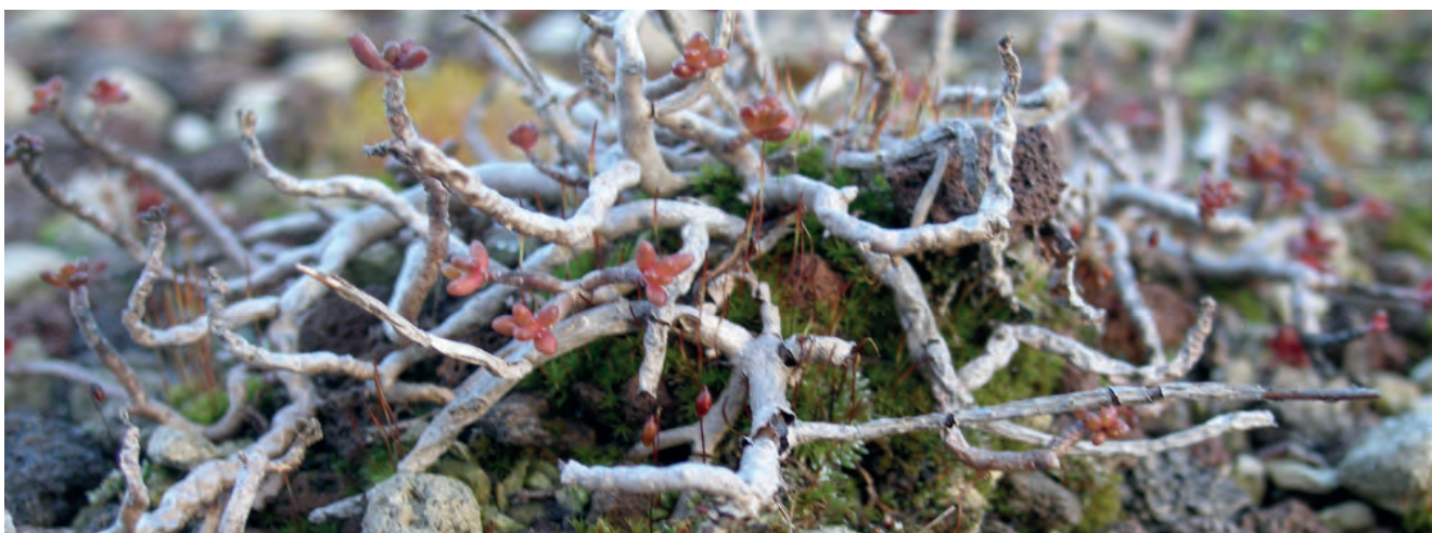
Abbildung 4: Wenn Sedumpflanzen Blätter verlieren und im Frühling und Sommer rot bleiben, dann leiden sie unter Nährstoffmangel.