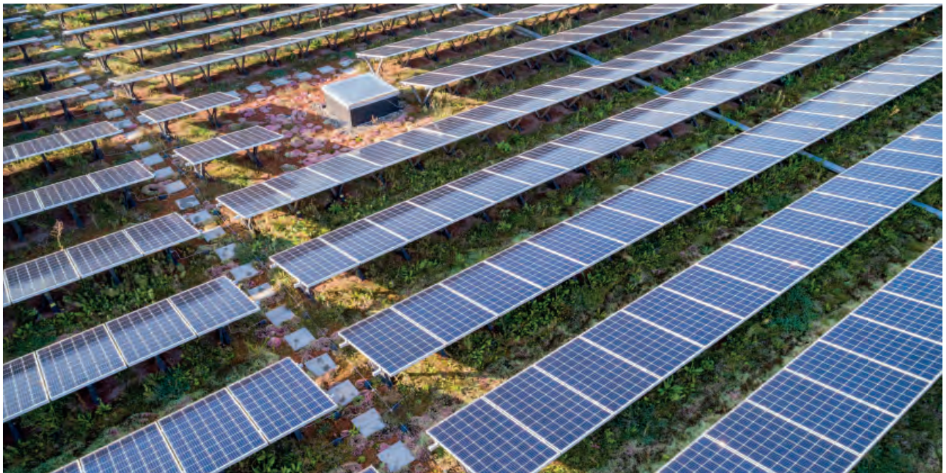
Abbildung 5: Auch grossflächige EnergieGrünDächer funktionieren bei einer richtigen und interdisziplinären Zusammenarbeit bei der Planung bzw. beim Bau und mit einem fachrechten Unterhalt.

Bei EnergieGrünDächern ist ausserdem darauf zu achten, dass die Vegetation nicht in die elektrischen Leitungen und in die Module einwächst und diese beschädigt.