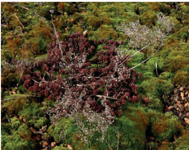
Abbildung 8: Vor allem auf sehr dünnen Substratauflagen, an Orten mit wenig Luftaustausch, Schattenwurf und hoher Luft- und Bodenfeuchtigkeit, können sich Moosarten so stark entwickeln, dass die Dachkräuter verdrängt werden!

Moospflanzen sind nicht in jedem Fall unerwünscht, dennoch wird das dominante Auftreten bei extensiven Begrünungen als Mangel angesehen. Bei der Beurteilung ist zu beachten, dass eine Bestandsumbildung durch Moose jahreszeitlich bedingt sein kann. Moose entstehen vor allem auf dünn-schichtigen Aufbauten und in einer Umgebung, wo temporär oder permanent hohe Luft- oder Bodenfeuchtigkeit herrschen. Das Mooswachstum wird begünstigt, wenn keine anderen Pflanzen wachsen, kein Luftaustausch auf der Oberfläche des Substrates stattfindet, wenn die Fläche lange beschattet wird und die Bereiche vernässt sind. Häufig treten Moose bei gefällslosen Dächern ohne Drainageschichten oder zu dünnen Substratauflagen auf. Abhilfe kann nur bedingt geschaffen werden, indem das Moos oberflächlich entfernt und die gewünschten Pflanzen gefördert werden.