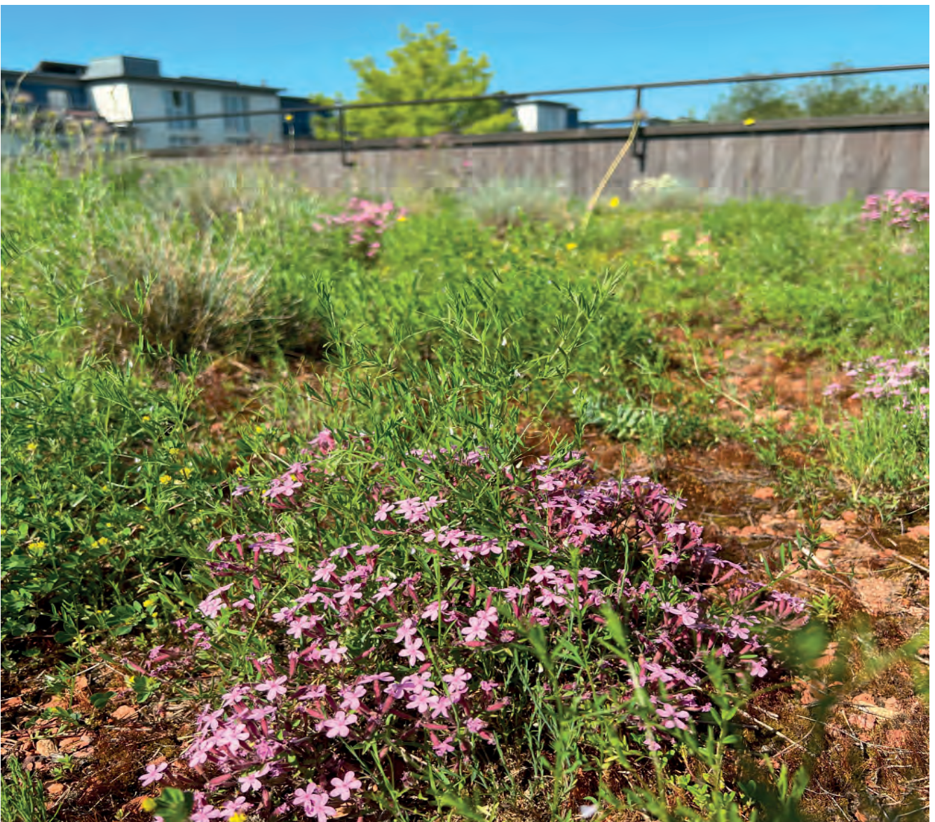
Abbildung 12: Extensive Dachbegrünung mit einem hohen Artenreichtum schaffen einen ökologischen Ausgleich und einheimische Pflanzen und Tiere, die aufeinander eingestellt sind, finden einen Lebensraum. Mit einer artenreichen extensiven Dachbegrünung wird ein kleiner jedoch wichtiger Beitrag zum Erhalt der Biodiversität geleistet.

Eine fachgerechte und gezielt terminierte Wartung und Pflege begrünter Dächer gewährleistet deren Funktion während ihrer ganzen Lebensdauer. Damit haben wir auch Problemarten im Griff. Wir erhalten mit funktionierenden Begrünungen die Artenvielfalt und die ökologischen Werte. Deshalb ist es wichtig, dass Wartung und Pflege der Dächer ab der Erstellung über die ganze Lebensdauer konsequent und in den notwendigen Intervallen durchgeführt werden.