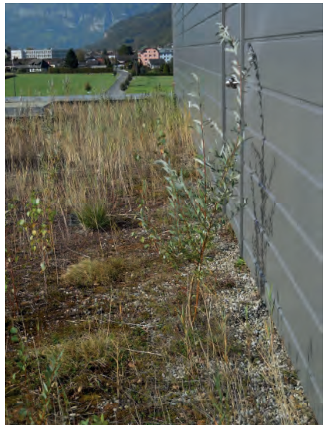
Abbildung 6: Schilfpflanzen und Gehölzschösslinge sind eine grosse Gefahr für die Dachhaut. Für Schilf gibt es bei Begrünungen ohne spezielle Schutzmassnahmen nur die Null-Toleranz.