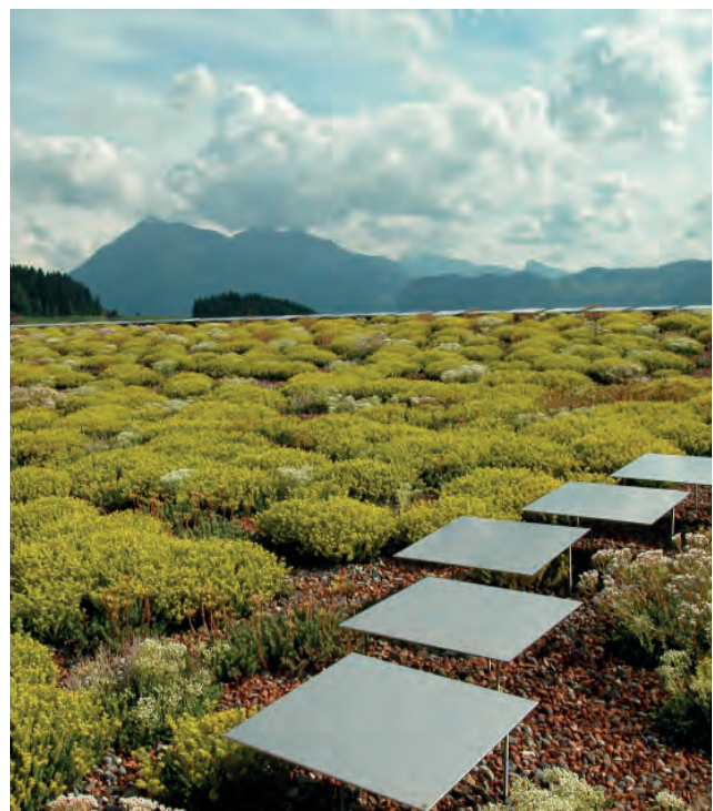
Abbildung 11: Extensive Dachbegrünung mit Sedum-Arten benötigen aufgrund der schwachen Aufbaustärke der Vegetationsschicht wenig Unterhalt und sind dadurch auch eine kostengünstige Methode Dächer zu begrünen. Sie sind jedoch monoton und für die Pflanzen- und Tierwelt nahezu wertlos.

Sedumarten werden in der Regel als lebende Sprossen ausgebracht, die in kürzester Zeit anwurzeln. Sedumsprossen sollen nur aus ungedüngten Produktionsbedingungen stammen, damit sie robust genug sind für die nährstoffarmen Verhältnisse auf Gründächern.