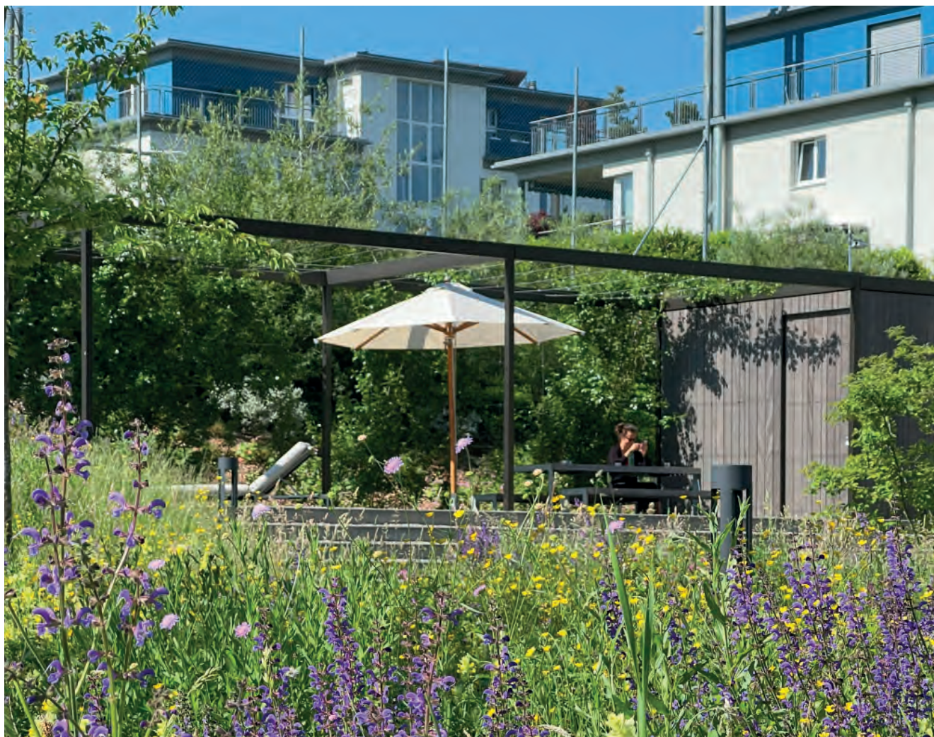
Abbildung 1: Begrünte Dächer sind Ersatzlebensräume für Tiere und Pflanzen in unseren Städten. Sie speichern und verdunsten Wasser, filtern Feinstaub und Lärm und gleichen sowohl im Sommer als auch im Winter Temperaturunterschiede aus. Intensiv begrünte Dächer sind grüne Oasen und lassen sich wie Gärten nutzen und steigern so unsere Lebensqualität und Gesundheit.