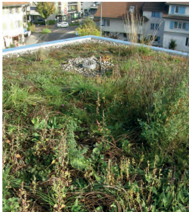
Abbildung 7: Extensive Dachbegrünung mit einem stark etablierten Fremdbewuchs. Bei Kurzkontrollen alle 4-5 Wochen ab Mitte April bis Ende Oktober, ist eine so starke Versamung und Ausbreitung nicht möglich.