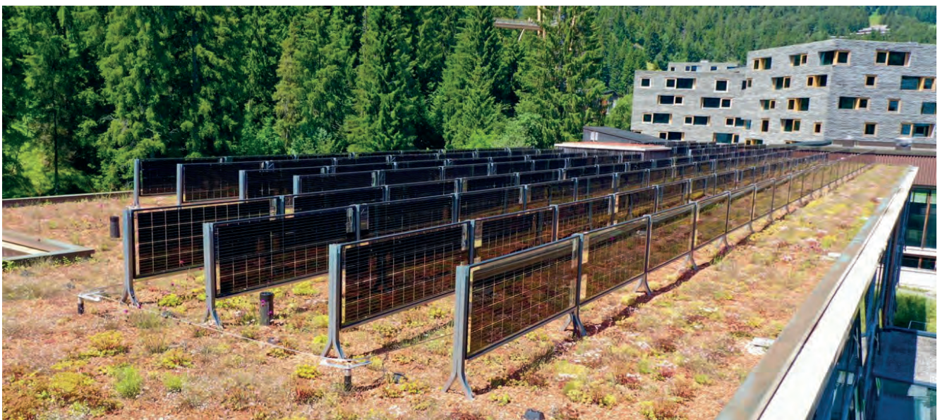
Abbildung 2: Das EnergieGrünDach ist eine Kombination mit Mehrwert. Werden die Paneele bifazial aufgeständert, entsteht eine hohe Leistungsfähigkeit der Dachbegrünung als ökologische Ausgleichsfläche.