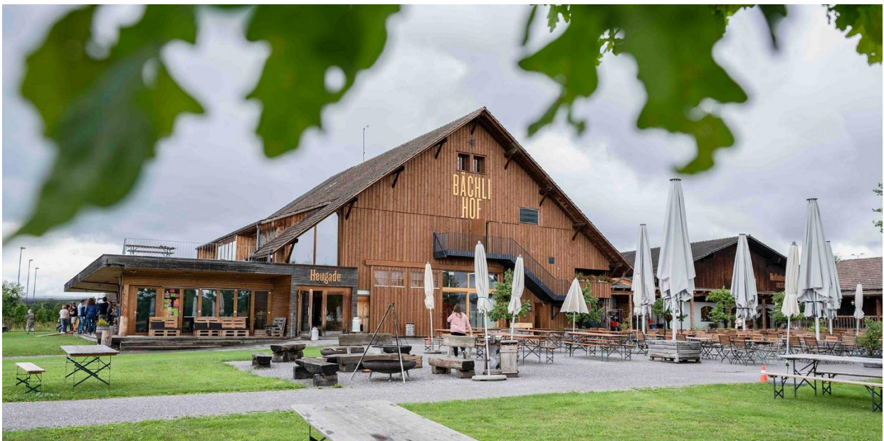
Bächlihof in Jona

Presse: g'plus, der gartenbau, Gebäudehülle Schweiz, hk gebäudetechnik, Schweizer Baujournal, Pavidensa